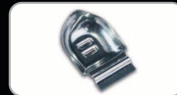
Molybdän-Schild für Halogen-Autoglühbirnen Molybdenum Shields for halogen car lamps