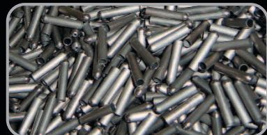
Niob/Zirkonium-Röhren für Natriumdampflampen Niobium/Zirconium tubes for Sulphur lamps