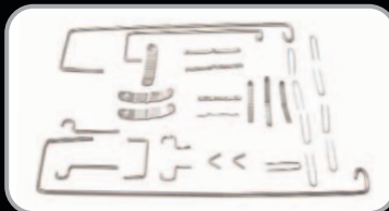
Molybdän und rostfreie Stahl-Teile Molybdenum and Stainless Steel parts